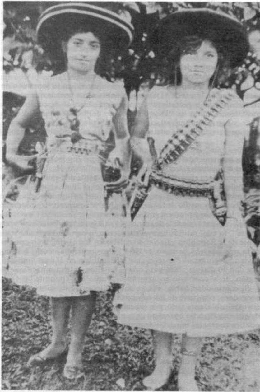
Las mujeres de la cuadrilla... foto encontrada a "Almanegra".

Además de su arraigo político y social en la zona, contaban también con otro factor que favorecía ampliamente sus actividades y su invulnerabilidad: la topografía. Puesto que la importancia de ésta tiene implicaciones sobre todo en el plano militar, la mejor fuente de apreciación la constituyen las observaciones que el propio ejército hacía al respecto. En su descripción general de la zona se señalaba lo siguiente: "El terreno comprendido por el municipio del Líbano, en su totalidad es quebrado, cubierto en su parte central por plantaciones de café, plátano y yuca. En su parte oriental se encuentran las estribaciones del Nevado del Ruiz, lugar este montañoso y de clima frío, apropiado para el refugio de las cuadrillas después de cometer ilícitos en otros sectores, o cuando son presionados