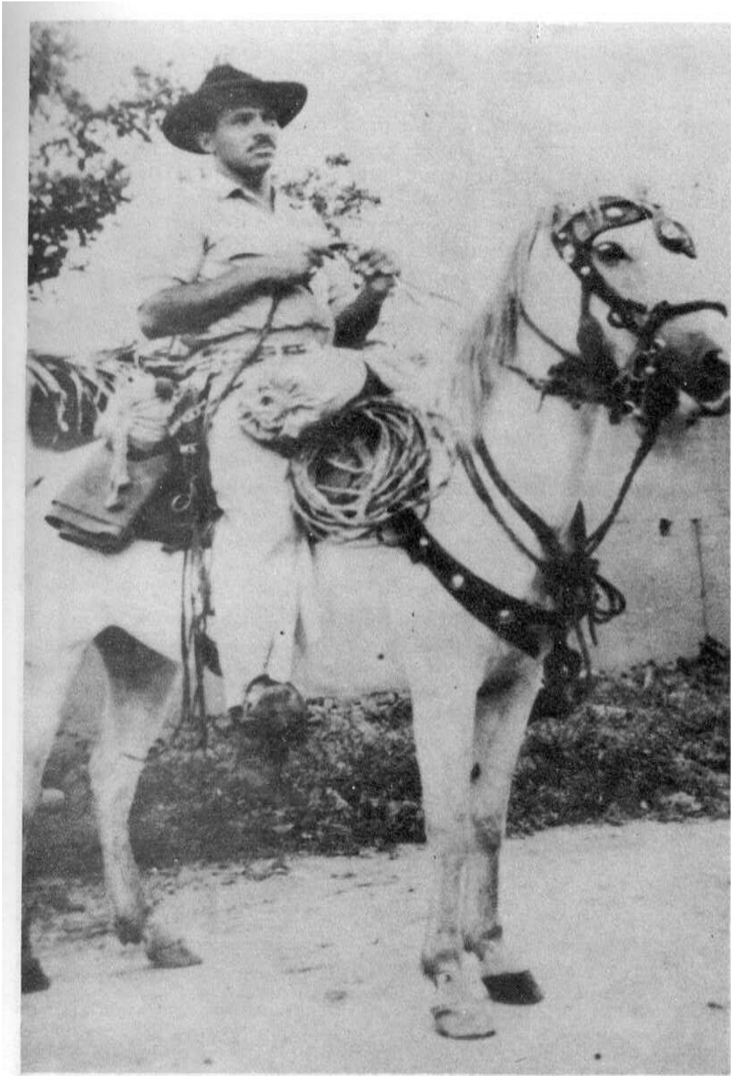
Guadalupe Salcedo, símbolo de la resistencia en los años cincuenta.