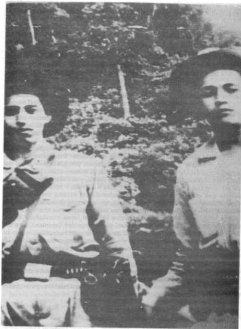
“Sangrenegra” a la izquierda y “Tarzán” a la derecha.

preocupación por guardar una cierta imagen de protector y benefactor, se manifestaba a veces en su renuencia a reconocer la participación en hechos que no habían sido enteramente de su parecer o que habían escapado a su control. Es significativa a este respecto, aunque ciertamente exagerada, la afirmación de la citada amante de “Sangrenegra” de que “‘Sangrenegra’ con ‘Desquite’ no se quieren porque ‘Sangrenegra’ es liberal y ‘Desquite’ es comunista” 80 . Que “Desquite” parecía actuar bajo normas diferentes a las de sus mismos prosélitos, lo evidencia igualmente uno de los procesos seguidos contra él y contra “Avenegra”, en el cual varios secuestrados, hombres y mujeres, declaran que insistentemente se quejaban ante “Desquite” de los abusos (sobre todo sexuales contra las mujeres) que cometían “Tarzán” y otros de sus subalternos, frente a lo cual “Desquite” intervenía siempre haciendo sentir su voz de mando y su autoridad reguladora 81 .