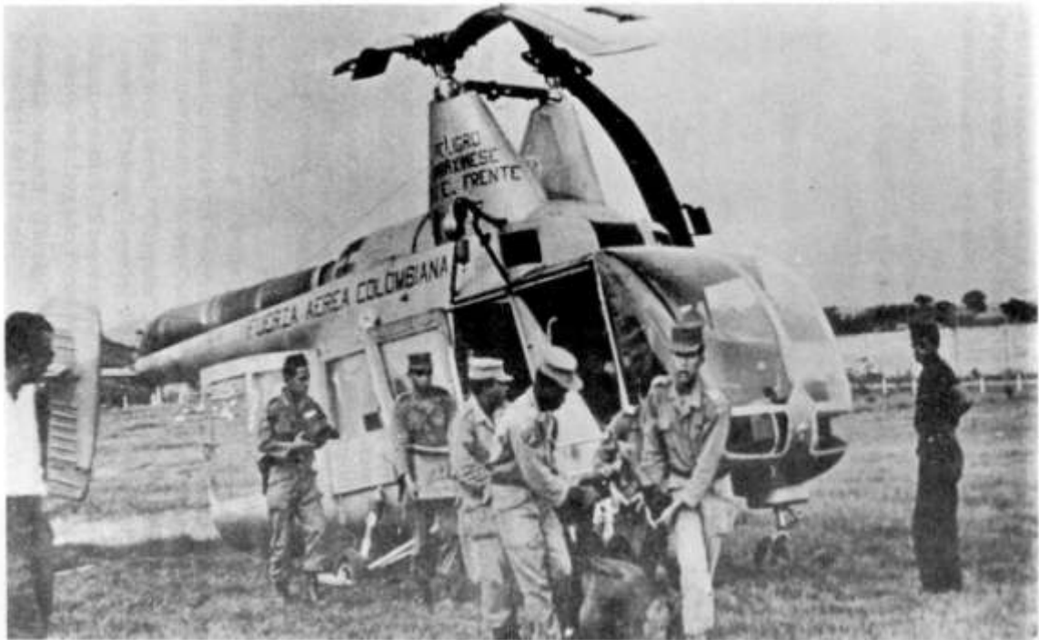
El cadáver de "Sangrenegra" es transportado en helicóptero por distintas regiones del Tolima en plan de exhibición.