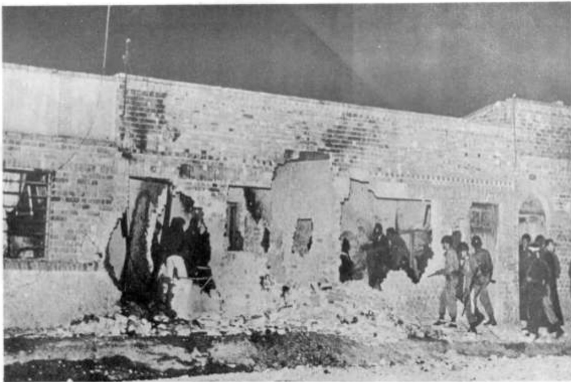
Bombardeada y ametrallada la casa-trinchera de Efraín González en el sur de Bogotá.

A tal punto llegó la reacción popular —afirmaba uno de los relatos de los días subsiguientes— “que el lugar donde cayó acibillado a balazos se convirtió en centro de romería y peregrinación con abundancia de imágenes sagradas, cirios encendidos y flores frescas; de todas las clases sociales ha habido testimonios allí, enumerándose no pocos centenares de lujosos automóviles; se cuenta que de distintas regiones del país, especialmente de Santander y Boyacá, han venido buses y camiones repletos de gentes con el objeto del peregrinaje y que es el propósito de amigos y válidos levantar en el lugar de su muerte una estatua a su memoria, como símbolo a la heroicidad y valentía del hombre que resistiera el peor asedio armado durante largas horas, haciéndole frente, en su soledad atormentada, a centenares de soldados y policías, equipados con poderosas armas modernas, patentizando una batalla que duró por definirse más tiempo que algunas batallas de la Independencia Nacional, y en cuya ejecución se dispararon miles de proyectiles y guijarros. Los admiradores del bandolero repiten ahora un estribillo: ‘De Efraín su muerte fue victoria, de Matallana la acción, la cobardía’; y agregan con sorna, que el Gobierno estuvo pensando en pedir refuerzos a los Estados Unidos” 59 .