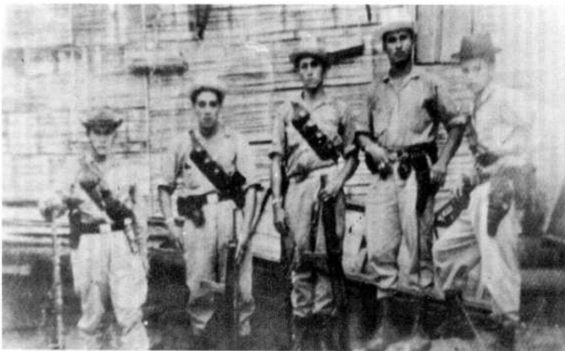
Adolescentes de una segunda generación, los "hijos de la Violencia".

En este contexto de continuos reveses del movimiento popular y frente al vigoroso intento de recomposición de las clases dominantes en el Frente Nacional, el bandolerismo surge, explicablemente, en amplias zonas rurales, como una respuesta campesina anarquizada y desesperada. Y como para los desesperados el único programa con sentido es el de destruir por destruir, el terror se convierte entonces no sólo en parte integrante sino también, en la mayoría de los casos, en elemento dominante de sus actuaciones