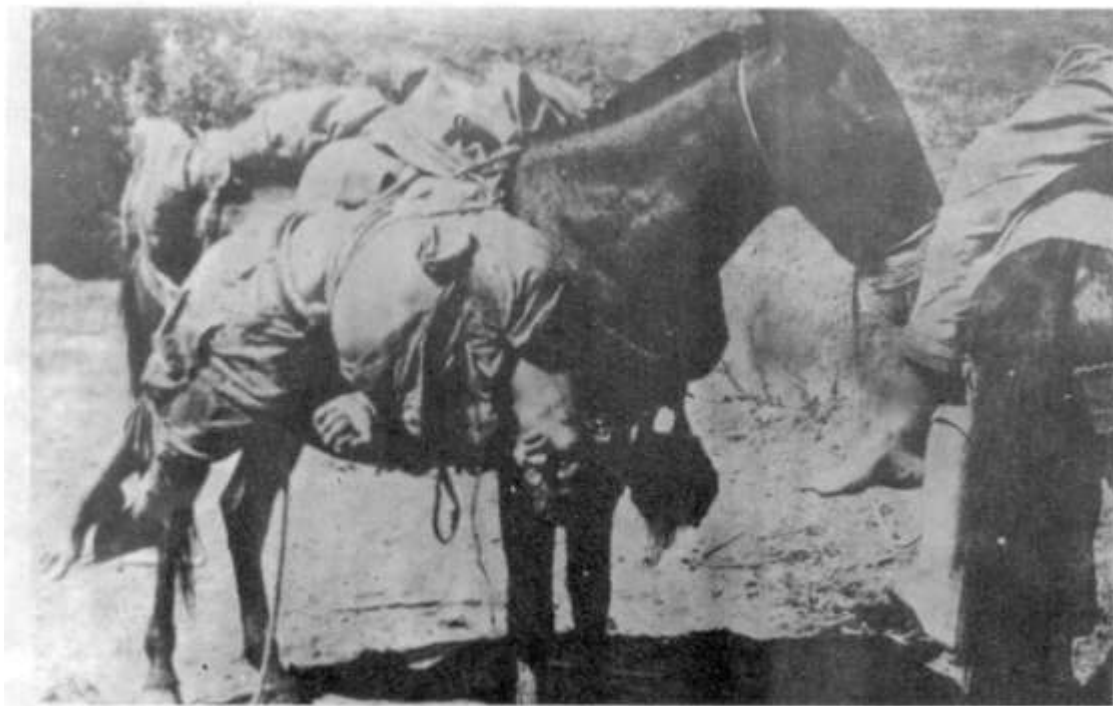
Las mulas que en tiempo de paz transportaban café, ahora conducían los cadáveres de los propios campesinos.

Después del equívocamente llamado gobierno de la “pausa” de Santos, el segundo mandato de López (1942-1945) permitió entender con mayor claridad, que la distancia entre lo esperado y lo realizado no respondía al presunto aplazamiento de las tareas de la “Revolución en Marcha”, sino a los límites inherentes a una lógica del desarrollo capitalista. Como resultado, Gaitán enarboló las banderas de la inconformidad popular concomitante a ese reconocimiento.