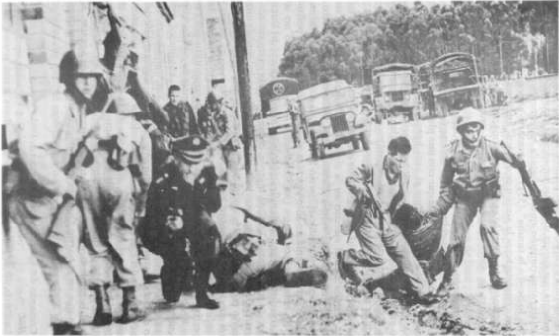
Se inicia la batida final contra un bandolero refugiado en un barrio bogotano...

decirse- de humillante victoria. En efecto, la multitud de más de diez mil personas que invadió la zona lanzaba vivas al bandolero y gritaba “asesinos... asesinos” a los agentes, al tiempo que en el barrio Quiroga se organizaban mítines de protesta 58 .