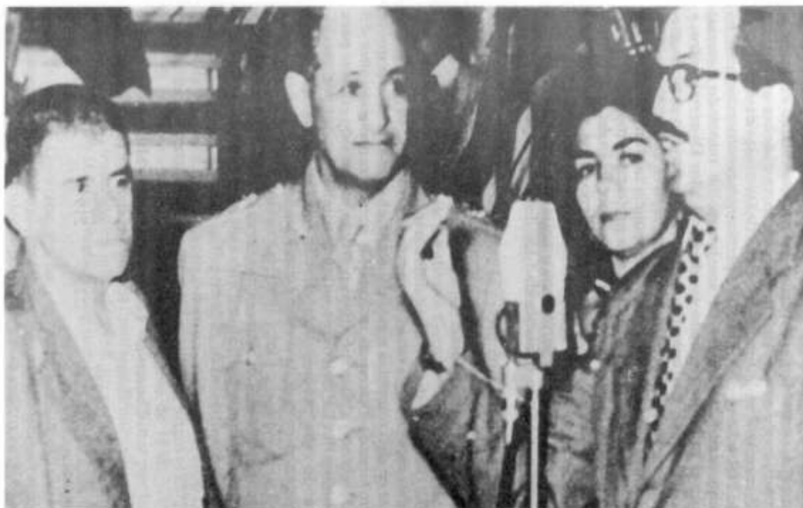
La controvertida foto con Rojas Pinilla al centro; el líder político del Valle, Salazar García a la derecha, y el célebre rey de los “pájaros”, “El Cóndor”, a la izquierda.

En todo caso, la tesis explicativa de la Violencia que pretendía reducir ésta a una fatal “herencia de la dictadura”, aludiendo con esta fórmula exclusivamente a Rojas Pinilla y no a Laureano Gómez, tendía un manto de silencio sobre los 150.000 y más cadáveres del período 1948-1953. Y en efecto, nunca antes se había insistido tanto en la necesidad de olvidar. Era, de hecho, la complicidad del Frente Nacional, en su propio momento de nacer, con el período que se invocaba estar superando. Pero era también una necesidad: las pretendidas democracia y libertad del Frente Nacional no podían erigirse sino sobre la base de un pasado dictatorial arbitrariamente delimitado. Además, el tiempo lo demostraría, su ideología de la “Paz” no era más que una máscara que presagiaba una nueva fase de la guerra.