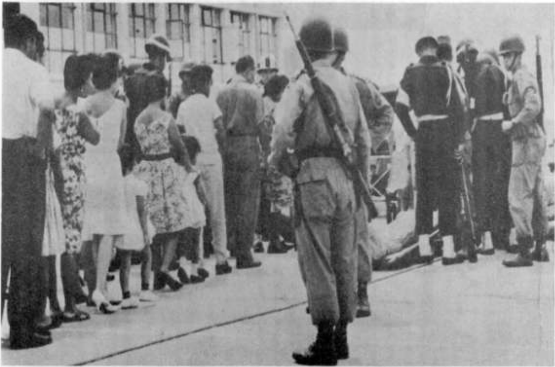
El cadáver de "Sangrenegra" expuesto a la curiosidad pública en las dependencias de la VI Brigada en Ibagué.