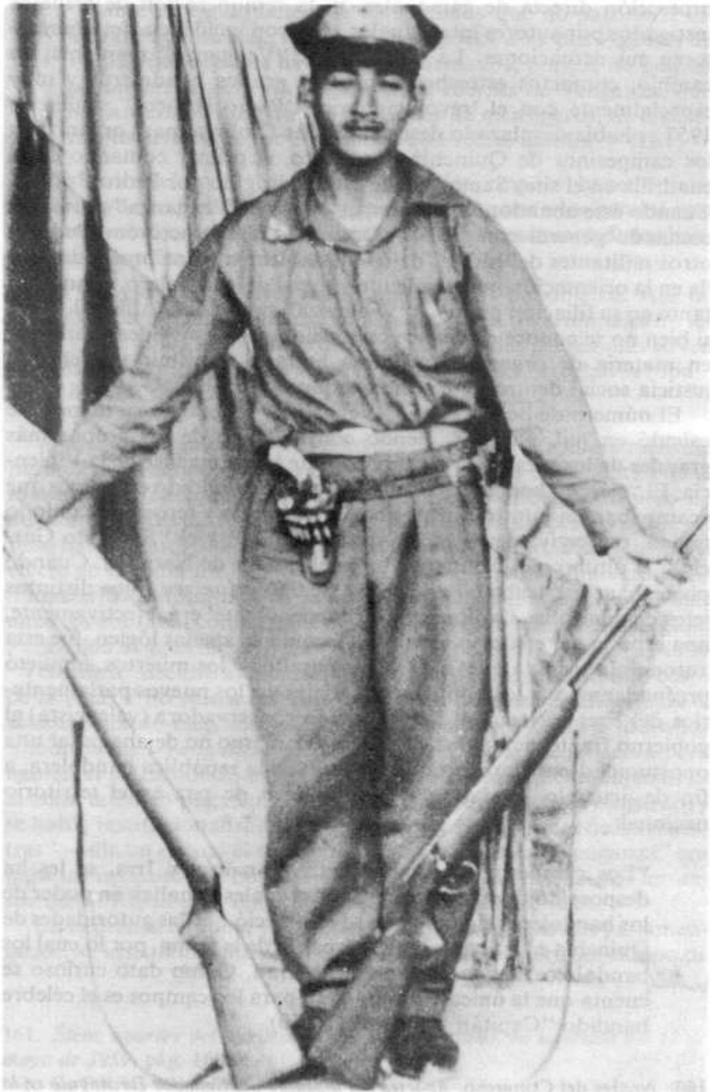
El "Capitán Venganza".