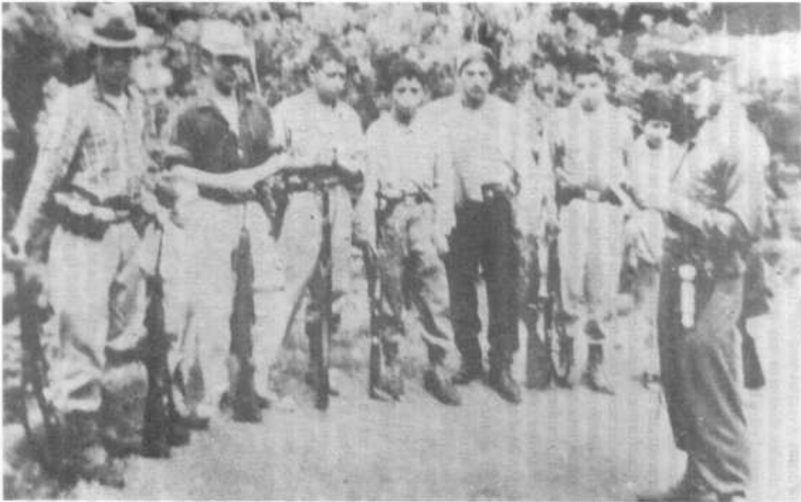
“Desquite” dando instrucción militar a su cuadrilla.

Pero ni “Desquite” fue el único con el cual se estableció una aproximación de este tipo; ni el MOEC fue el único en promoverlas. Emisarios de una disidente fracción del Partido Comunista estuvieron a punto de perecer en manos de “Sangrenegra” cuando intentaron realizar esa misma tarea.