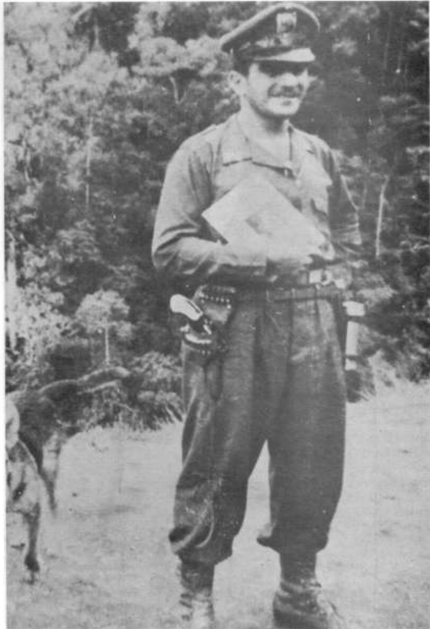
El "Capitán Desquite".

el hogar, a los diez años, y se trasladó a la población de El Cairo, en el departamento del Valle, donde vivió su adolescencia. Al regresar a El Cairo en 1948, después de haber prestado su servicio militar, dio muerte a un hijo del jefe conservador de la localidad y, prófugo de la justicia, se reunificó con sus padres en su pueblo natal, Santa Isabel, en el Tolima, en donde cambió de bandera partidista, pues ya no podía sentirse cobijado por aquella a cuyo nombre se le perseguía. Más aún, sentía la necesidad de combatirla, y en ello, por diversas circunstancias, se identificaba con muchos campesinos liberales que ya lo estaban haciendo organizados en cuadrillas 62 .